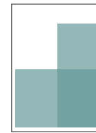
1/2 side • højformat • tværformat